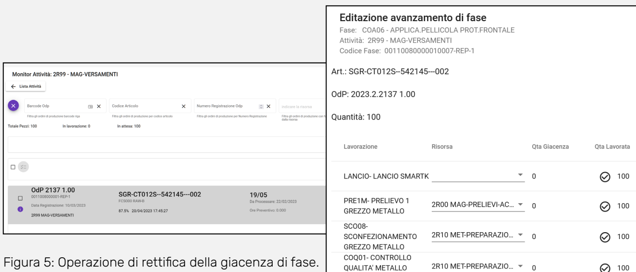
Figura 5: Operazione di rettifica della giacenza di fase.